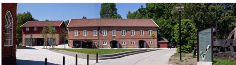
Park, stensetting og skilt er TFs bidrag til verdiskapingen i prosjektet. Til venstre for snekkerverkstedet midt på bildet går veien opp til Øvre Verksgård, dvs den gamle Kullepladsen.

Forvalterboligen fra slutten av 1600-tallet kalles "Admini". Deler av kostnadene ved gress, stensetting og skilting er TFs økonomiske bidrag til verdiskapingen. Men fortsatt ingen historisk informasjon.