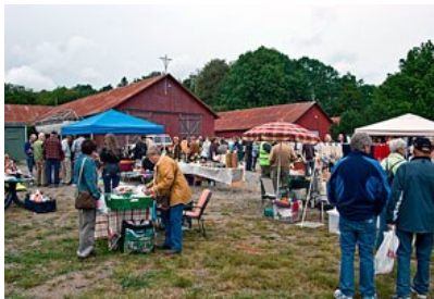
Markedsdagene på Øvre Verksgård trekker alltid mange mennesker. Velforeningen er en flott arrangør.

Vi husker godt at fylkespolitikerne ville varsle innsigelse mot dette punktet i Byplanen, men de ble overtalt av sin egen administrasjon til å la være. Innsigelse kunne de varsle senere, fikk de høre. Så enkelt er det nok ikke, og byråkratene jobber der fortsatt. ( Klikk her og her )