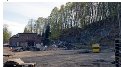
Valseverket under oppussing sett fra motsatt side etter at jernlageret ble revet. Til høyre i bildet rester etter masovnen fra 1845.

Til høyre for Valseverket ser vi en ny forstøtningmur og den moderne skarpe bruddstenen skjærer i øynene. Her trengs en forklaring: I innledningsfasen til Verdiskapingsprosjektet fjernet TF effektivt og uten søknad og tillatelse restene etter den gamle muren.