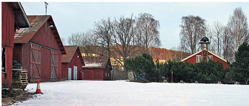
Over: "Kullepladsen". Klokkeboden med verksklokken til høyre i bildet, i det fjerne skimtes Bøkeskogen. Under: Grunneiers siste forslag til nybygg på Kullepladsen.