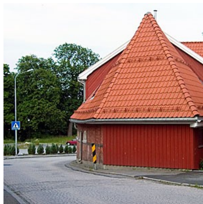
Over: Til venstre i svingen har prosjektmakerne fått øye på nok en byggetomt.

Så krysser vi gaten og befinner oss på parkeringsplassen foran Larvik Museum og Verksporten. Vi er nå på hellig grunn. Her lå Langestrands eldste kirke og restene av kirkegården med knokler og hodeskaller etter masovnsarbeidere og masmestre ligger under asfalten. Utsikten over Farriselven og til byen er karakteristisk - enn så lenge.