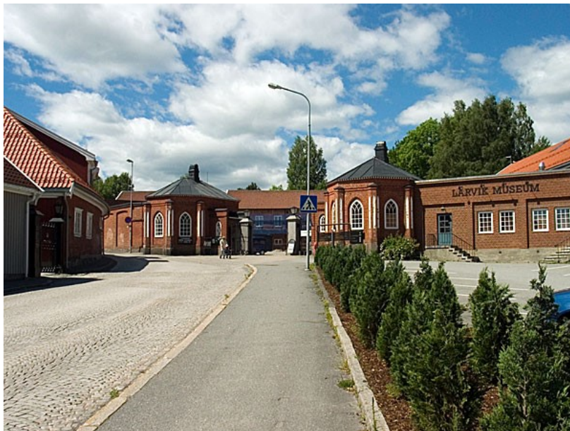
Verksporten med portbygninger i nygotikk ble oppført i 1856. Parkeringsplassen til høyre planlegges altså nedbygget.

Verdiskapingsprosjektet har finansiert avfotografering av arkivmaterialet om kirkebyggene på Langestrand. Materialet befinner seg lett tilgjengelig i offentlige arkiver, men skal ifølge prosjektmakerne kun gjøres tilgjengelig for prosjektet selv og Treschow. Men det følger kanskje ingen forpliktelser med den offentlige finansieringen?