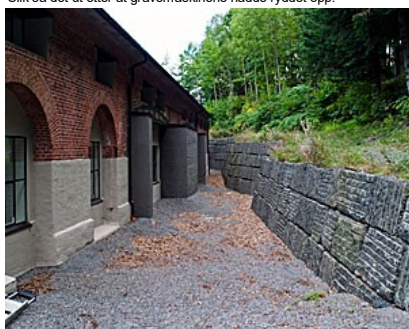
Slik ser det ut etter "restaureringen".