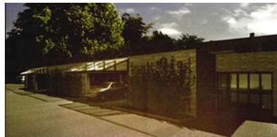
Parkeringshuset i front av Oberinspektøranelegget. Her kunne det senere bygges blokk oppå - i tråd med kommunens Byplan. Stoppet av MD i 2006.

Fortidsminneforeningen varslet Miljøverndepartementet som så satte foten ned og forlangte at terrenget ikke skulle endres. (Klikk her - her )