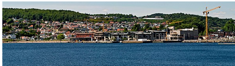
Langestrand og Hammerdalen har fått stortint selskap i front. På Batteristranda hvor jernmalmen ble røstet kan du nå bli spadd og knadd på hotellet. Slik så det ut fra Tollerodden under byggeperioden.

Derfor tar vi en spasertur på området for ved selvsyn å se hvilke konkrete spor Verdiskapingsprosjektet kan vise til når det gjelder den synlige historien og menneskene som la grunnlaget for Fritzøe jernverk og dagens Larvik. Hvordan forvaltes den materielle arven etter Danmark-Norges største og viktigste jernverk?