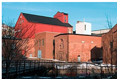
Den store, røde Mølla i bakgrunnen.

Etter flere år og mange møter gav kunstnerne opp og etablerte seg andre steder. De fleste har flyttet til Sjøparken Agnes nærmere Stavern. Nå har musene overtatt her, de skal jo også ha et tilfluktssted vinterstid, så kanskje katten maler?