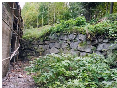
De gamle forstøtningemurene som er beskrevet allerede i 1751 fikk stå i fred for gravemaskinene frem til prosjektoppstart i desember 2006. Her stod de eldste masovnene fra 1644.

Utvendig er huset satt pent i stand, innvendig er alt nytt og flott og vi forstår at dette har kostet mye penger. Men hvor ble det av historien om Fritzøe Jernverk?