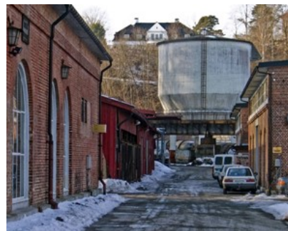
Det gamle jernlageret i rødmalt tre ble revet i 2005. (Valseverket fra 1851 til venstre.) I dag parkeringsplass - imorgen byggeplass hvis Verdiskapingsprosjektet for det som det ønsker. Og hva med skjebnen til vanntårnet?