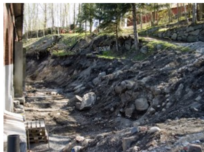
Slik så det ut etter at gravemaskinene hadde ryddet opp.