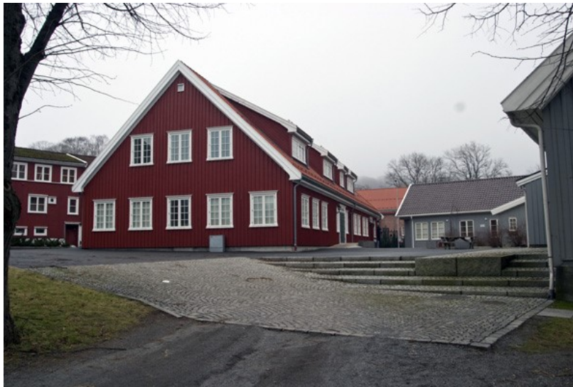
Fylkeskommunen som kulturmyndighet sa seg såre fornøyd med den falske kopien - vinduene fikk kittfals! Den rettvinklede, skarpe estetikken kjenner vi fra Fritzøe Brygge. De skarpe kantene kan bli et karakteristisk særtrekk ved gamle Fritzøe verk

Bak oberinspektørens bolighus befinner vi oss inne på dobbelttunet og registrerer at midtfløyen som ble revet i 2001 er erstattet med en falsk kopi. En annen fløy ble revet få år tidligere. Begge revet med kommunal og fylkeskommunal velsignelse. Området er kjemisk fritt for historisk informasjon. Fritzøe Museum er lukket og låst slik det alltid har vært.