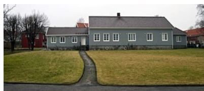
Oberinspektør-anlegget fra 16/1700-tallet ligger tvers over gaten for Langefamiliens nedrevne kapell og den karakteristiske Verksporten.

Bildet viser hvordan Verdiskapingsprosjektet ønsket å utvikle området med parkeringshus.